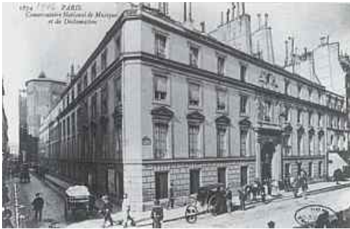
Das Konservatorium im 19. Jh., vor dem Umzug in die Rue de Madrid um 1910